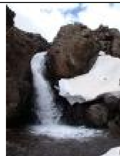
Wasserfall auf dem Toubkal