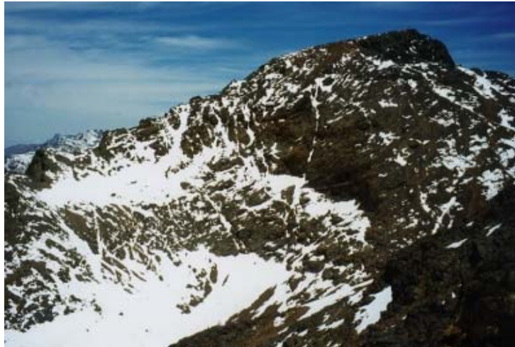
Der Toubkal, höchster Berg Marokkos (4165m)

8 Tage/7 Nächte, davon 6 Tage Wanderung mit 4 bis 5 Stunden Wandern pro Tag Von März bis Ende Oktober Für Anfänger geeignet